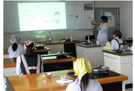
魔法の焼きそばを作ってみよう ~天然色素のひみつ~