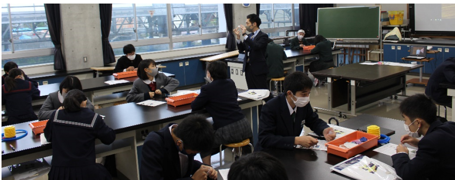
風船ホバークラフト作り 摩擦のない運動を体験してみよう