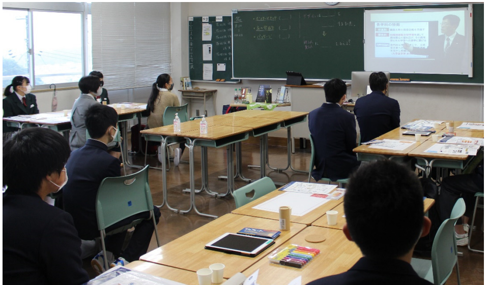
デザインはなぜ必要なの? ~ボトルのパッケージデザインをしよう!~