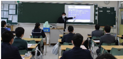
数字のマジックを体験!

10月10日(土)受験校を考える中学生の皆さんに仙台城南高校の日常を見ていただくことを目的に、校長先生の挨拶や各学科の説明をビデオ上映にて行い、17の授業を公開しました。その他に個別相談ブースや部活動体験など、本校で送る高校生活をイメージしてもらいました。足元の悪い中たくさんの参加者の方が来校されました。ありがとうございました。