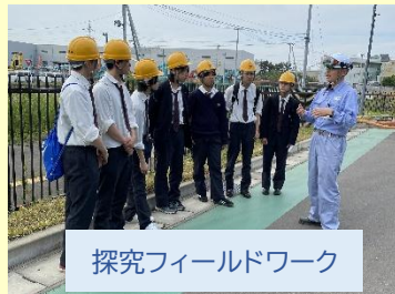
探究フィールドワーク

普通科・総合進学コースでは、1年「探究基礎」、2年「探究Ⅰ」、3年「探究Ⅱ」と継続的に取り組んでいます。また、科学技術科でも3年で「課題研究」に取り組み、自らの興味・関心に基づいて探究的な学習を行っています。