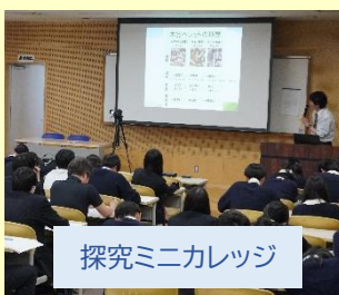
探究ミニカレッジ