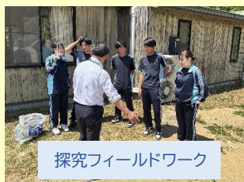
探究フィールドワーク