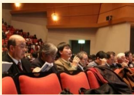
審査員からの質問